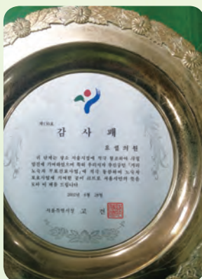
02. 6. 28 : 요셉의원, 서울시장 감사패 받음