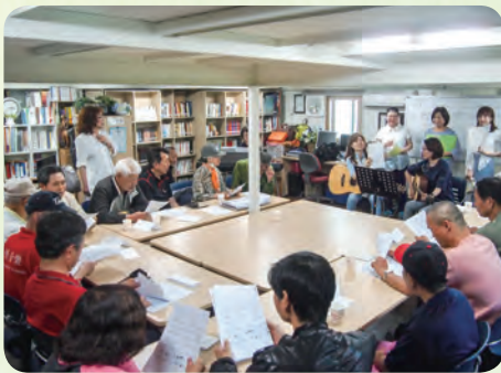
11. 3. 15 : 음악치료교실 개설