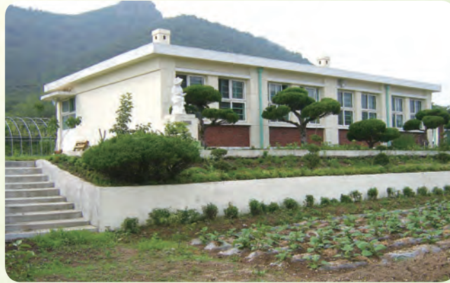
06. 11. 18: 고창 요셉의집 개설