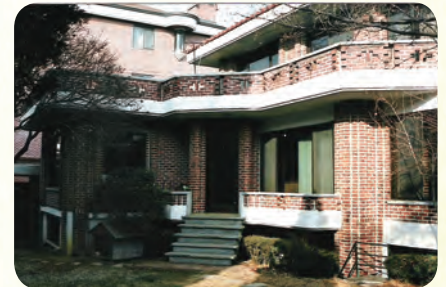
96. 8. 23 : 목동의집 개설