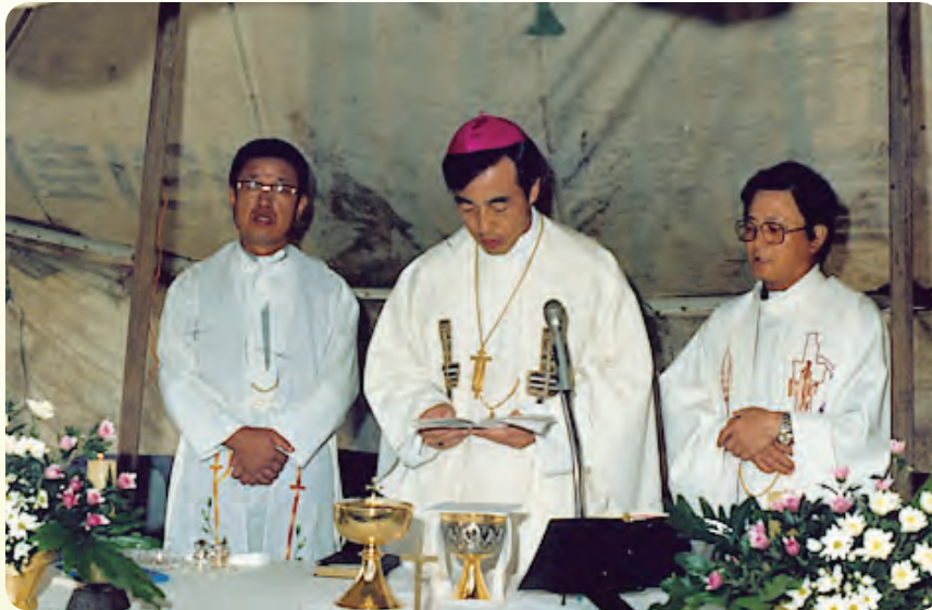
87. 8. 29 : 요셉의원 개원 미사