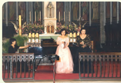
00. 4. 27 : 제1회 노래의날개위에 개최