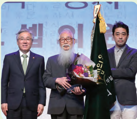
16. 5. 13 : 요셉의원, 대통령 표창 받음