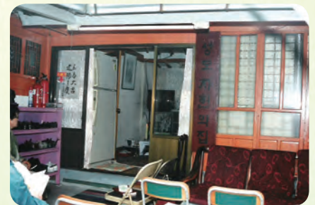
00. 10. 21 : 성모자현의집 개설