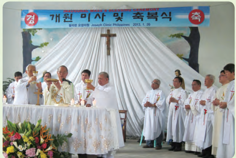
13. 1. 26: 필리핀요셉의원 개원